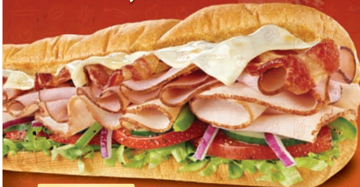
Subway Melt 12"